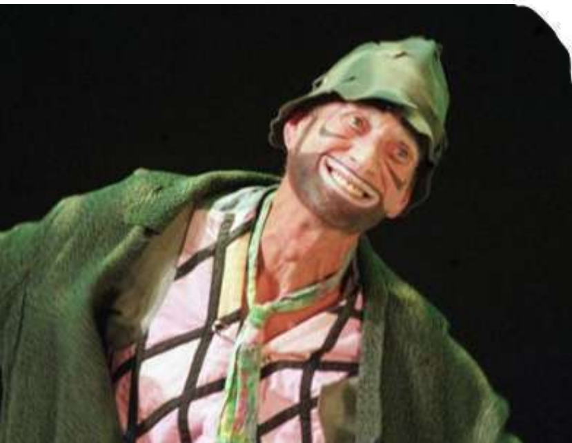
Le personnage de Sol Marc Favreau

Extrait du discours de la servitude volontaire, 1576, Etienne de La Boétie