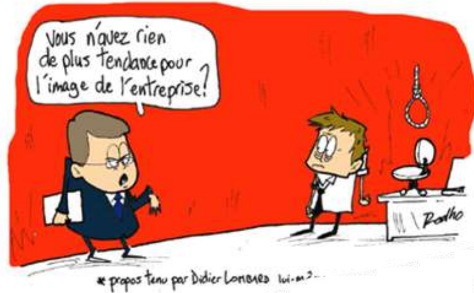
Dessin de presse, 2009 Rodho

Le patron de France Télécom déplore cette "mode du suicide"